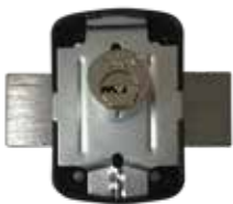
Vista del cilindro