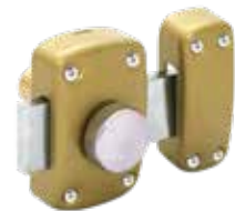
Disponible en dos acabados diferentes