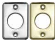
Escudo embellecedor a juego con el cilindro